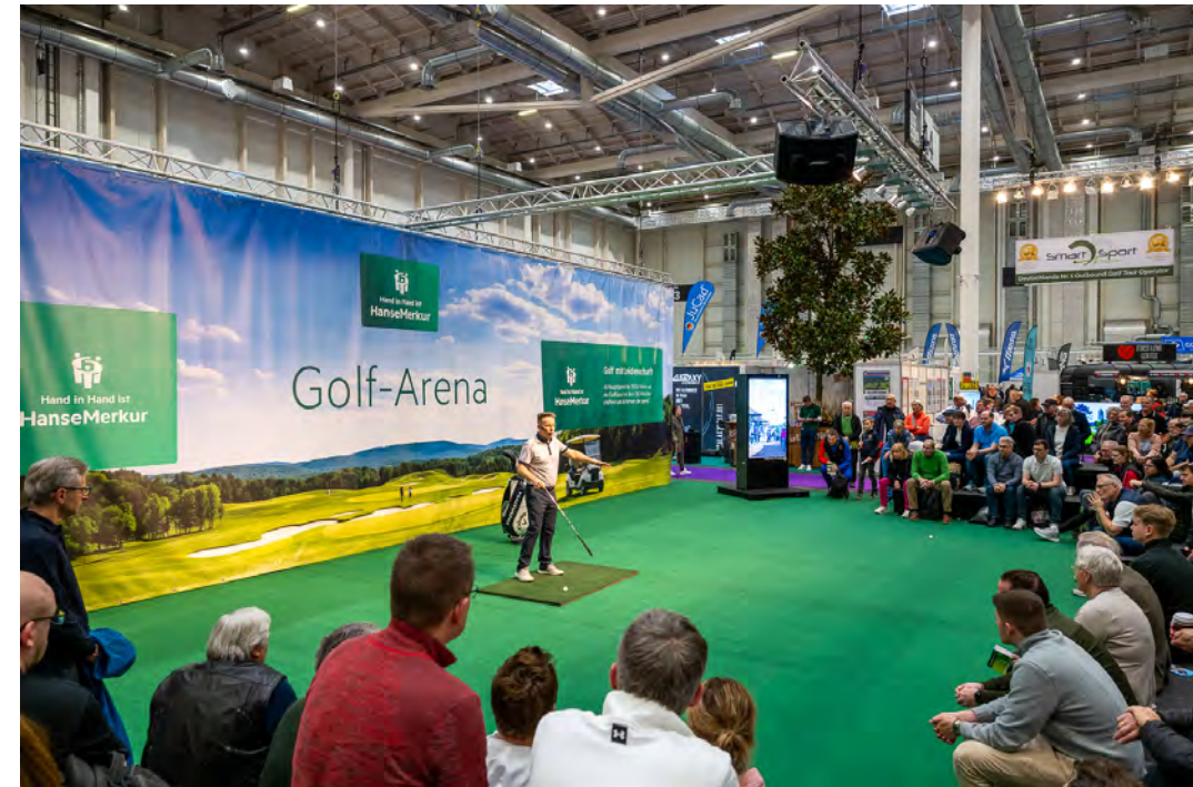
Die Golf-Arena presented by HanseMerkur 2024

Jedes Paket kann noch individuell besprochen werden.